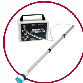
QuickTake 30 与VersaTrap孢子盒长杆采样棒