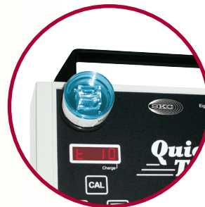
QuickTake 30 在泵入口上装有VersaTrap孢子盒采样