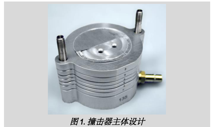
图 1. 撞击器主体设计

Models 135-6 和 135-8 型可与个人采样泵一起使用，因为它们具有低压降。Model 135-10 型由于最后两级的压降较大，需要使用真空泵进行采样。